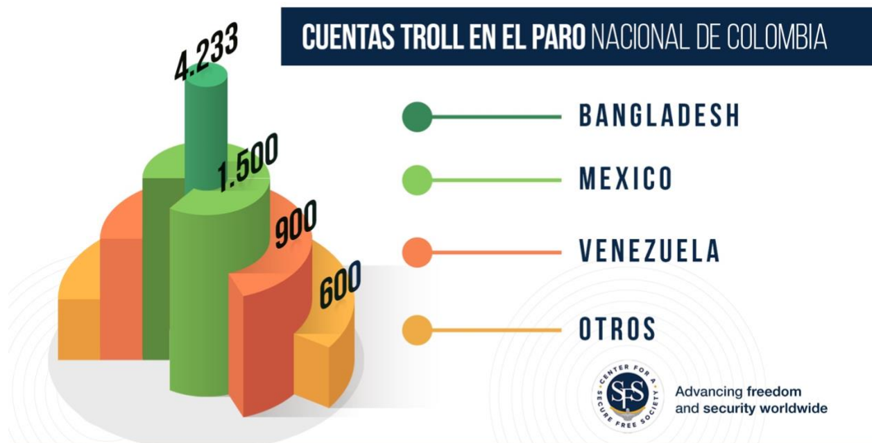
FUENTE: DATOS ANALIZADOS EL 5 DE MAYO DE 2021 POR MARCEL RAMIREZ, INTELIGENCIA ARTIFICIAL, MINERIA DE DATOS, MIAMI, FL

Según el Laboratorio de Investigación Forense Digital (DFRLab) del Atlantic Council, la sesgada información también fue generalizada durante las actuales protestas en Colombia. Un ejemplo ordinario, se da cuando reciclan videos de protestas en otros países y presentarlos incorrectamente como imágenes de protestas actuales. El DFRLab cita específicamente ejemplos de imágenes recicladas de enfrentamientos entre policías y manifestantes de 2019 en Ecuador y Chile, que fueron presentados erróneamente por periodistas y académicos colombianos como evidencia de fuerza excesiva por parte de ESMAD, una unidad policial especializada en antidisturbios que fue desplegada para controlar las protestas. 25 Estos errores son comunes en medio del caos, sin embargo, el daño reputacional que le hacen a las fuerzas policiales y de seguridad colombianas es casi irreversible, erosionando aún más la legitimidad del gobierno de Duque.